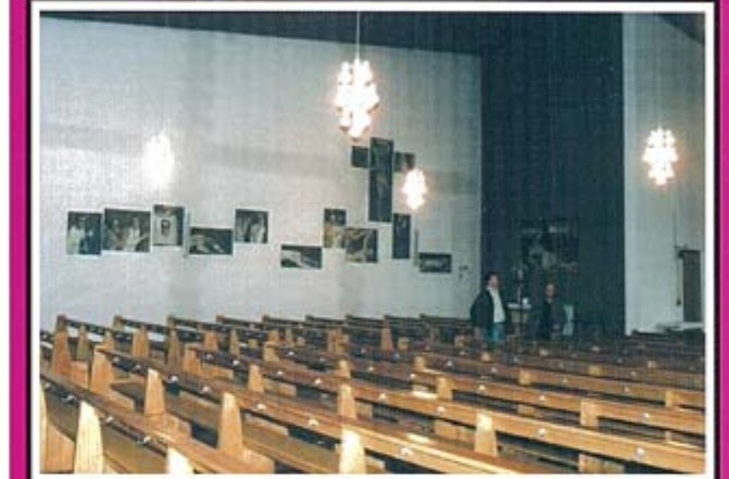
Außenwand einer Kirche mit Wärmebrücken und Abzeichnungen hervorgerufen durch Tauwasser

epatherm -Wohnklima-Platten bestechen durch erstklassige technische Werte in puncto Trockenrohdichte, kapillare Wasseraufnahme und Wasserdampfaufnahme.