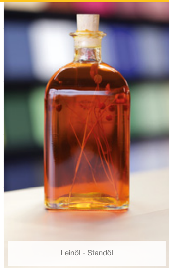
Leinöl - Standöl