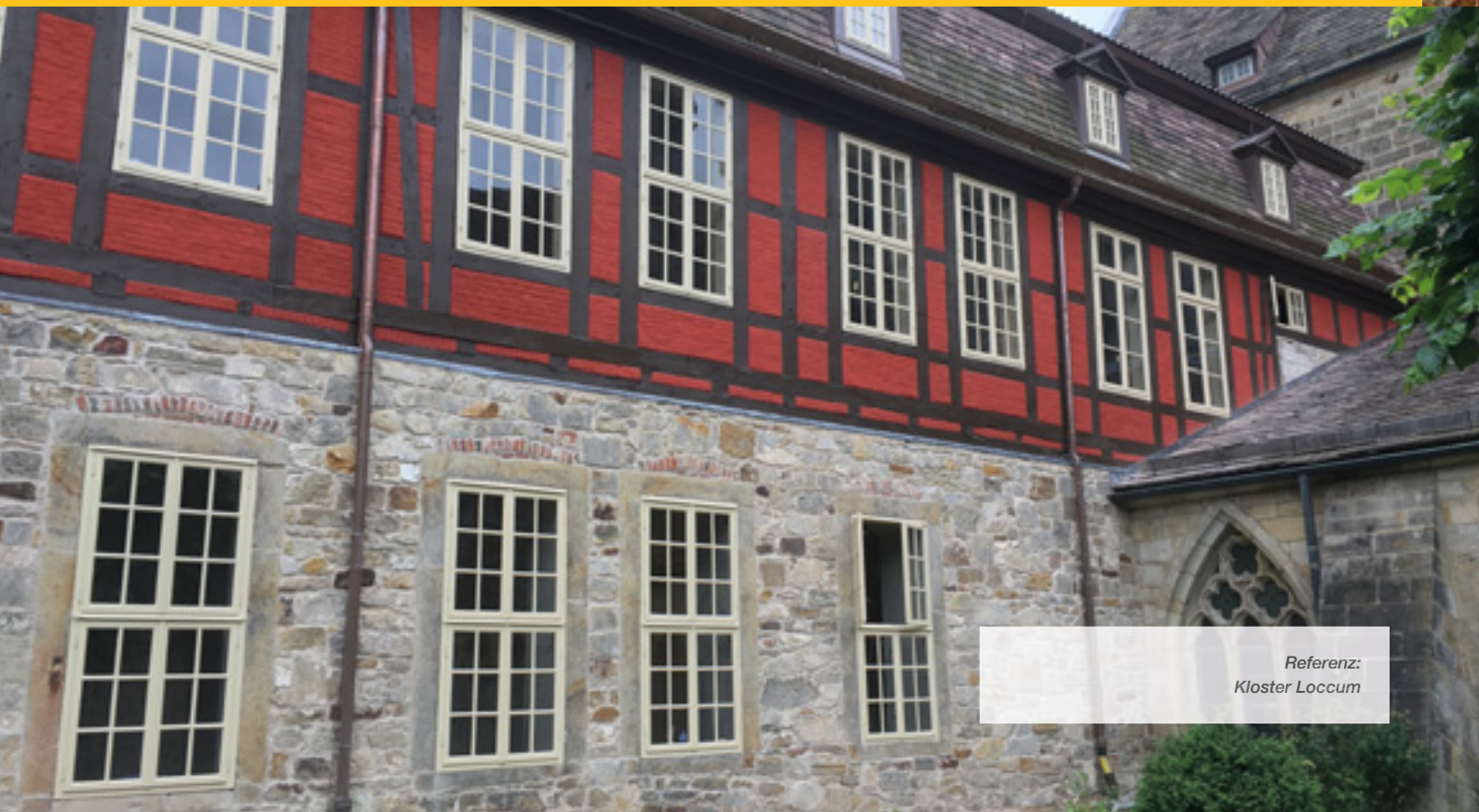
Referenz: Kloster Loccum

Ölfarben sind ein historisches Kulturgut in Kunstmalerei, Bauhandwerk und Restaurierung, sind Werterhaltung mit Naturprodukten, sind Unikate, kreativ und zeitlos schön. Mehr als nur eine Alternative zu anonymen synthetischen Kunstharzlacken!