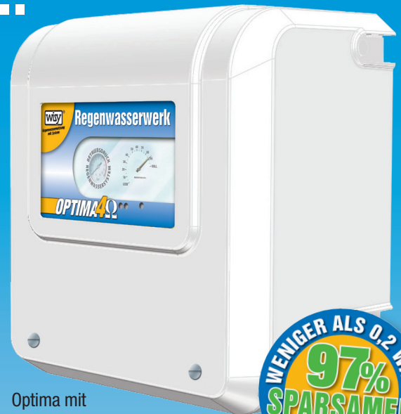
Optima mit Abdeckhaube